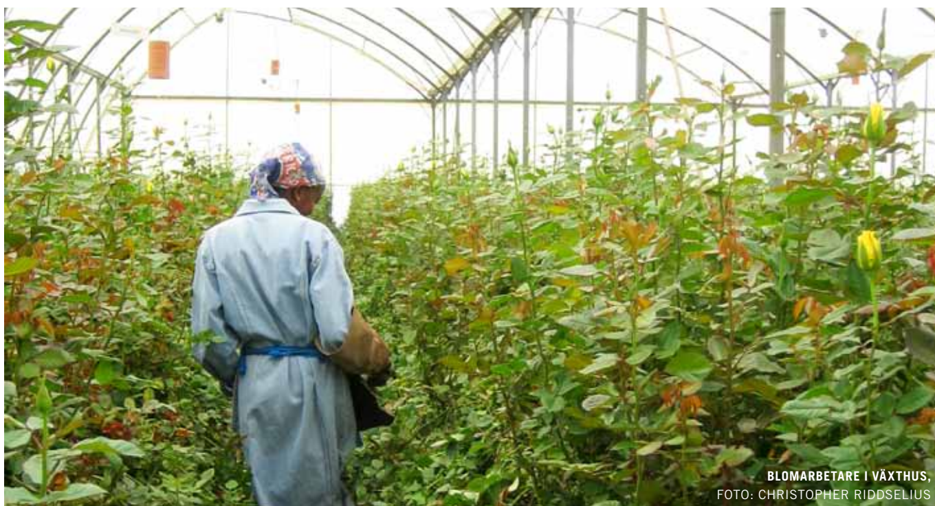
BLOMARBETARE I VÄXTHUS

I rapporten har både fackhandeln och dagligvaruhandeln granskats samt importörer/grossister. Dagligvaruhandelns aktörer är många gånger stora koncerner som arbetar med olika produktgrupper, varav snittblommor är en. Dagligvaruhandelns arbete vad gäller socialt ansvar i leverantörsleden är därför oftast mer omfattande och utvecklat, vilket kan kopplas till fler resurser och mer uppmärksamhet från omvärlden.