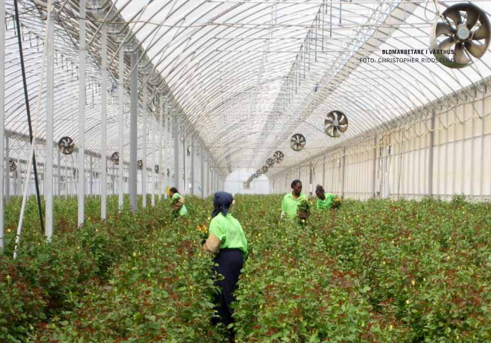
BLOMARBETARE I VÄXTHUS.