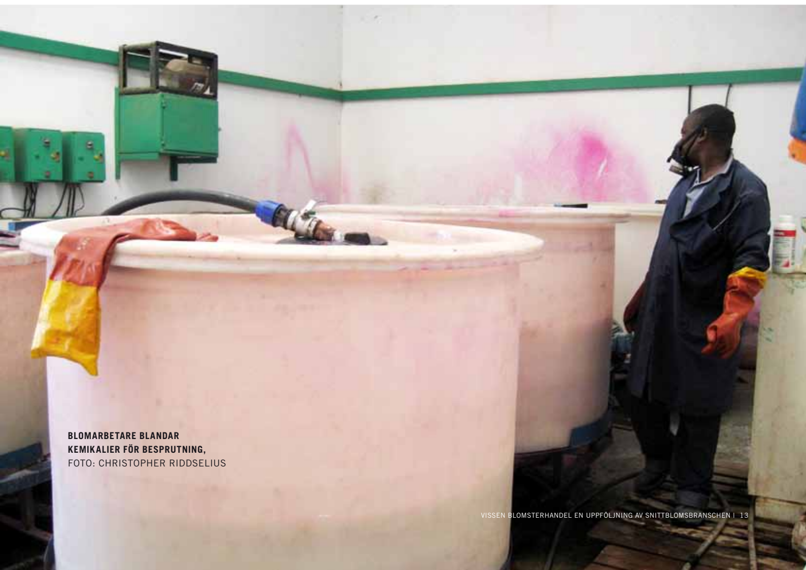
BLOMARBETARE BLANDAR KEMIKALIER FÖR BESPRUTNING, FOTO: CHRISTOPHER RIDDSELIUS