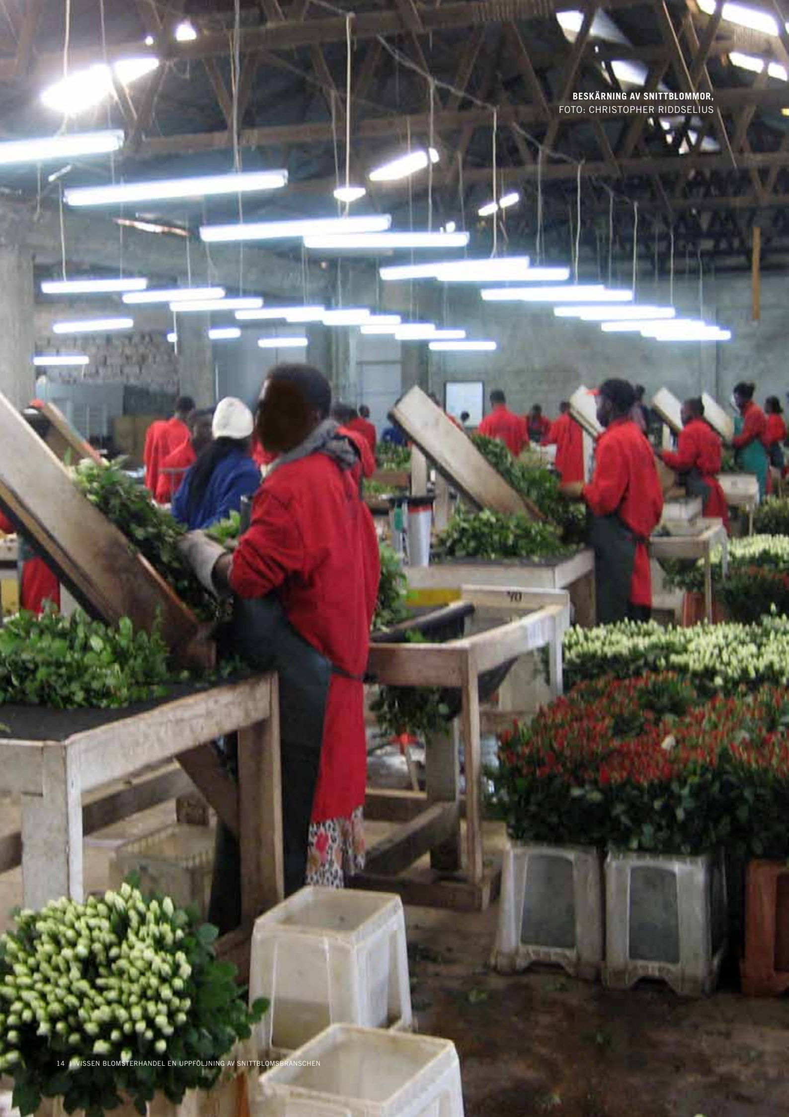
BESKÄRNING AV SNITTBLOMMOR